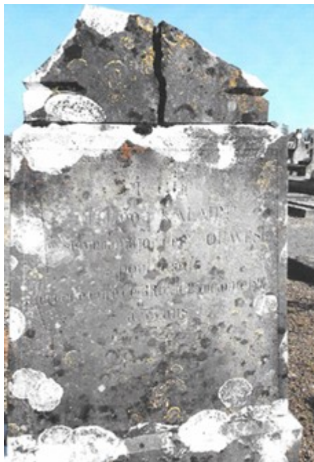
Sa tombe au cimetière de Brux